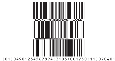
拡張多層型 (Expanded Stacked)