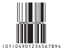
標準二層型 (Stacked Omnidirectional)